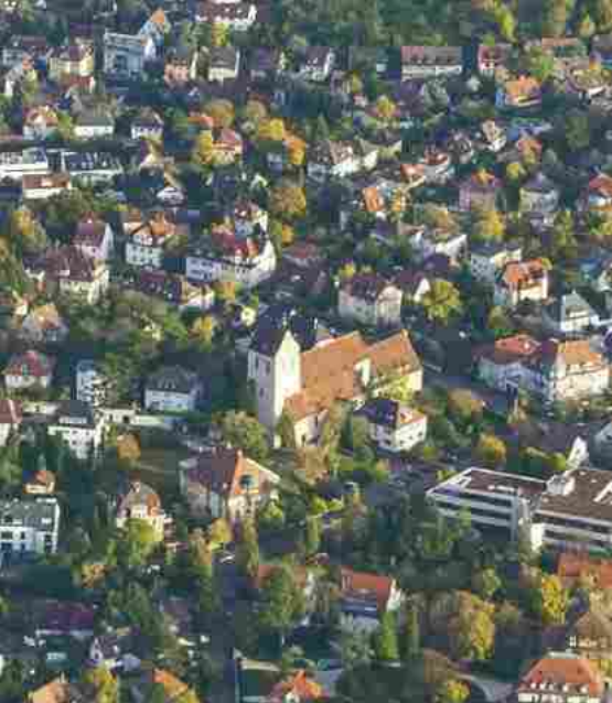
Die Christuskirche auf der Gänseheide aus der Vogelperspektive