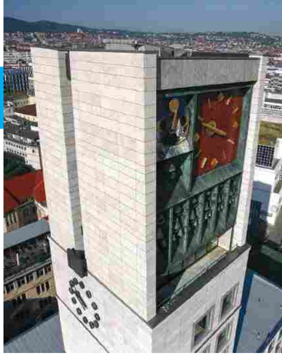
Modern, aber nicht sehr geliebt: Das Stuttgarter Rathaus von Paul Stohrer und Paul Schmohl

TREFFPUNKT Eingang Hoppenlau-Friedhof an der Rosenbergstraße, • ENDPUNKT Liederhalle • € 33,50 inkl. kleinem Leichenschmaus • ANMELDUNG ERBETEN