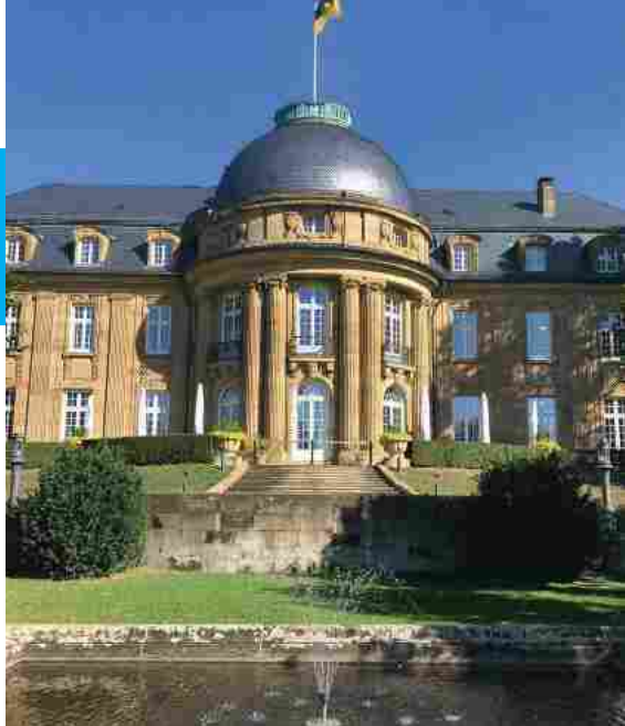
Die Villa Reitzenstein: Adelige Villa und Staatsministerium

TREFFPUNKT Weinstube „Zur Kiste“, Ecke Kanal- straße/Esslinger Straße • ENDPUNKT Wilhelms- platz • € 14 ohne Essen • ANMELDUNG ERBETEN