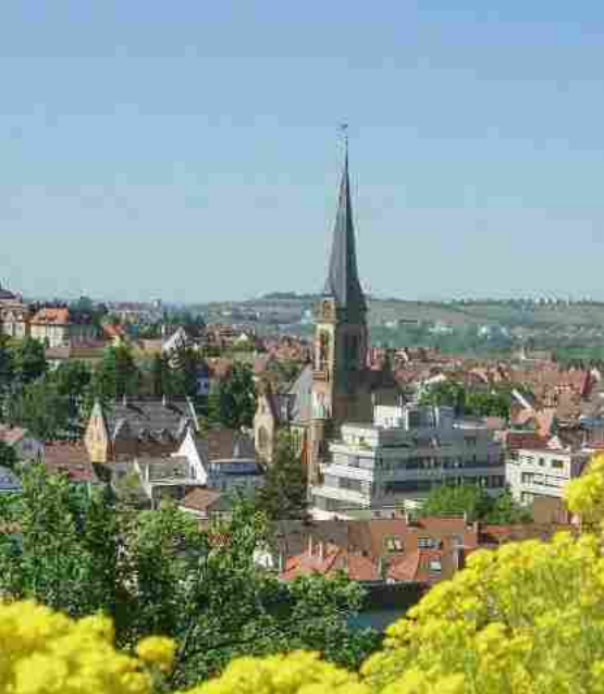
Frühling in Gablenberg mit Blick auf die Petruskirche