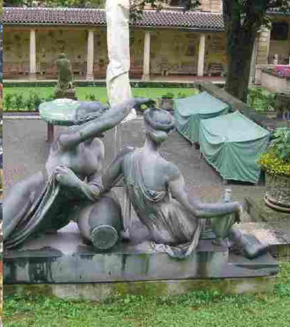
Ein wunderschön verträumter Ort im Stuttgarter Süden: Das Lapidarium