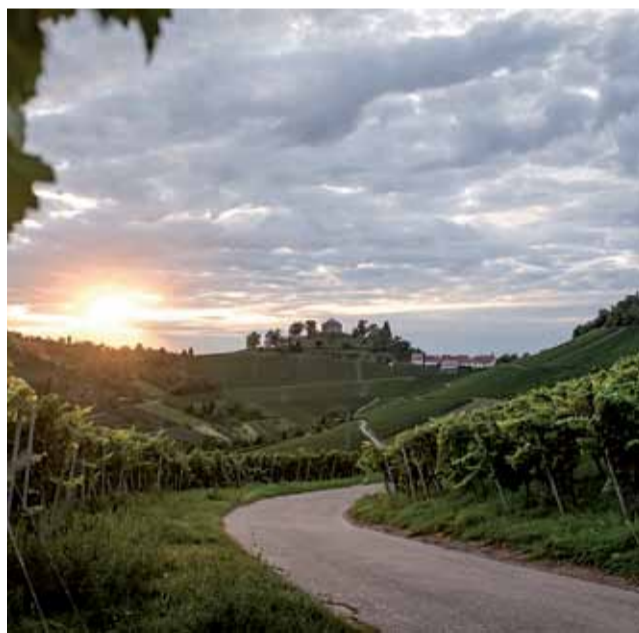
Grabkapelle Stuttgart und Weinberge