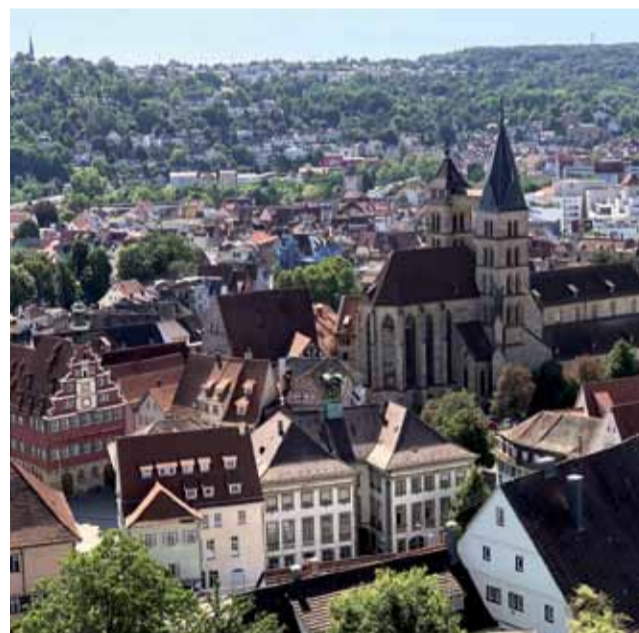
Das Ziel der beschaulichen Wanderung: das romantische Esslingen am Neckar