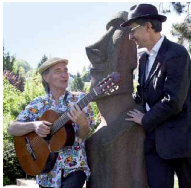
Die beiden „Hinter-Weltler“ am Santiago-de-Chile-Platz

TREFFPUNKT Lagerhaus an der Lauter, Gomadingen-Dapfen, Lautertalstraße 65 • ENDPUNKT Am Ausgangspunkt • 29 Euro • ANMELDUNG Lagerhaus, Telefon 07385 965825, info@lagerhaus-lauter.de