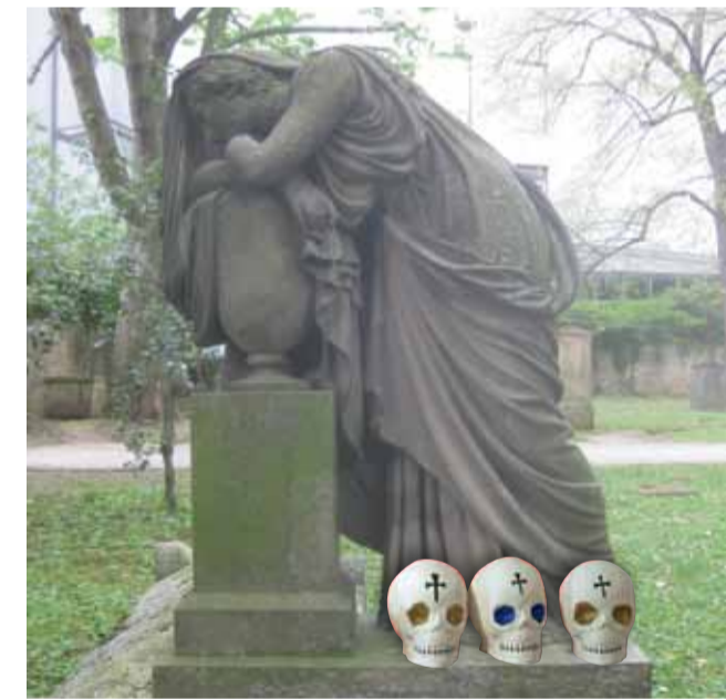
Dia de los Muertos auf dem Hoppenlau-Friedhof