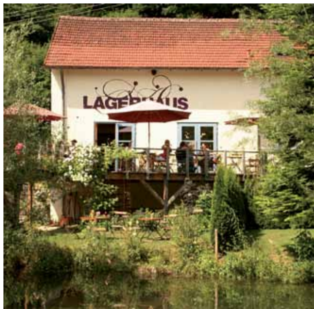
Das Ausflugslokal „Lagerhaus“ in Gomadingen-Dapfen an der Lauter

Weitere Infos: 0711/2624117 oder info@bernd-moebs.de Alle Termine sowie aktuelle Ergänzungen auch auf der Homepage www.bernd-moebs.de