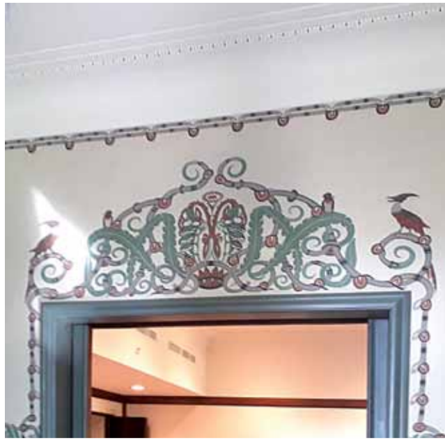
Das Gartenzimmer im Robert-Bosch-Haus

TREFFPUNKT vor dem Kunstgebäude „Goldener Hirsch“ am Schlossplatz • ENDPUNKT Schlossplatz • 18 Euro inkl. Verkostungen • ANMELDUNG ERBETEN!