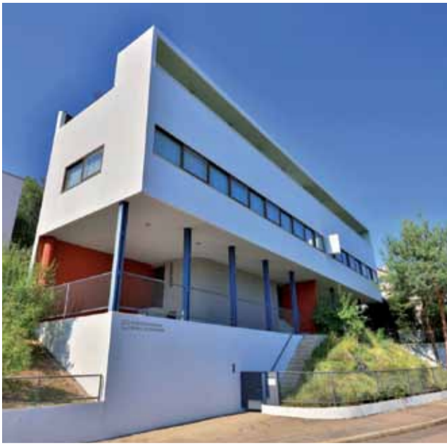
Das Le-Corbusier-Haus in der Stuttgarter Weißenhofsiedlung