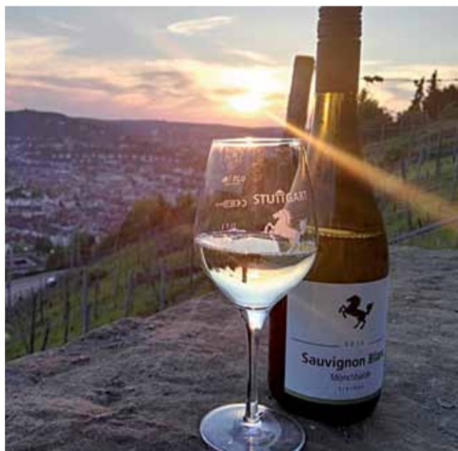
Wein und Hügel in Stuttgart, ein Genuss!

TREFFPUNKT Bushaltestelle Linie 43 Marien-/Silberburgstraße, Nähe S-Bahnhalte Feuersee • ENDPUNKT Lapidarium, Mörikestraße • 21 Euro (inkl. Eintritt Lapidarium) • ANMELDUNG ERBETEN!