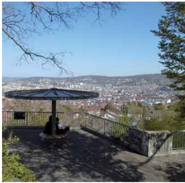
Die Zeppelin-Aussichtsplattform in Stuttgart-West

TREFFPUNKT Nach Anmeldung per Mail und Überweisung erhalten Sie den ZOOM-Link • 12 Euro • ANMELDUNG ERBETEN!