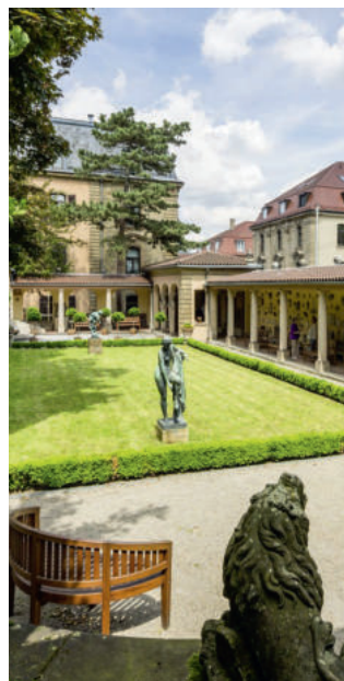
Das Lapidarium an der Karlshöhe.