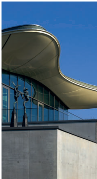
Das Gebäude der Sammlung Fröhlich.