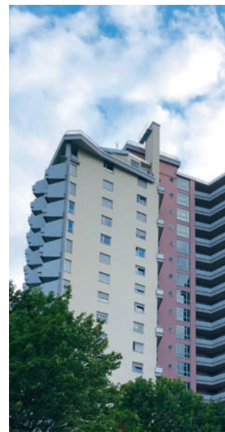
Das Hochhaus »Salute« von Hans Scharoun im Fasanenhof.