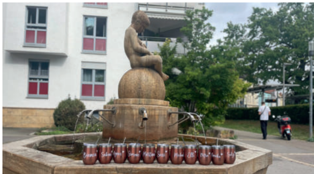
Der Lautenschlägerbrunnen in Bad Cannstatt, Foto: Martina Fürstenberger